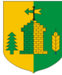
Koigi valla vapp

Koigi valla pindala 204,45 km 2 , keskus Koigi külas