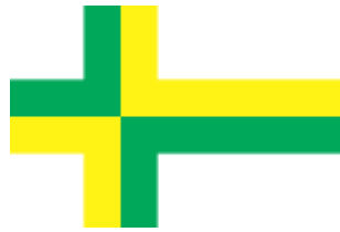
Koigi valla lipp