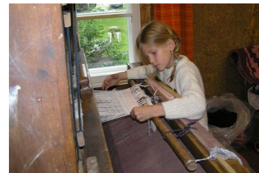
Kangakudumise leidis enda jaoks 2009 a.