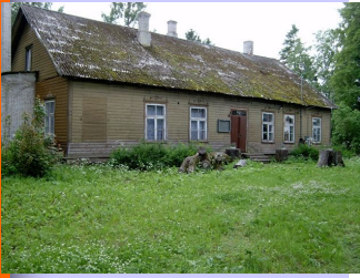
Sõrandu koolimaja 2004. aastal

1911. aastal on kooli asutamiseks Sõrandu külas märgitud 1860. aasta.