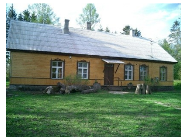
Sõrandu koolimaja (KÜLAMAJA) 2010

1952. aasta protokollis on kirjas, et enne kooli tuleks võrrelda kooliõpilaste nimekiri